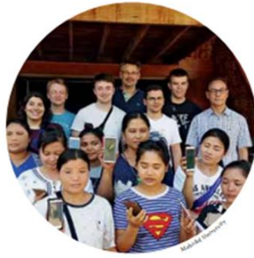
Im Kampf gegen Malaria: Probanden testen eine App zur Nachverfolgung von Infektionen.