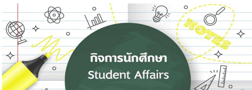
Student Affairs: Student Activities /Student service and benefit unit

2. กิจกรรมที่จัดโดย สภานักศึกษามหาวิทยาลัยมหิดลและสโมสรนักศึกษา มหาวิทยาลัยมหิดล คณะเทคโนโลยีสารสนเทศและการสื่อสาร มหาวิทยาลัยมหิดล ชมรมระดับมหาวิทยาลัย เป็นอีกองค์กรหนึ่งที่จัดกิจกรรมต่าง ๆ โดยนักศึกษาให้เป็นไปตามวัตถุประสงค์ของชมรมในด้านต่าง ๆ ได้แก่ ด้านบำเพ็ญประโยชน์ ด้านศิลปวัฒนธรรม ด้านกีฬา ด้านวิชาการ เป็นต้น